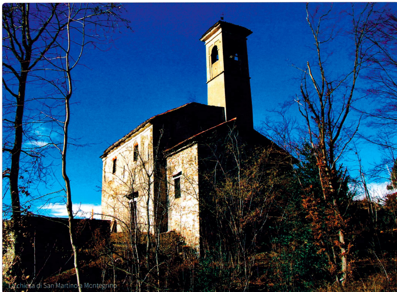
La chiesa di San Martino a Montegrino

in cui risulta essere pagato con denaro e terreni.